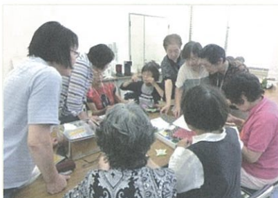
こちらのテーブルは折り紙!