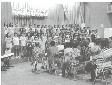
ステージ 古田小6年生合唱