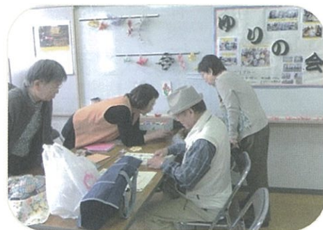
公民館の「ふるた遊・友フェスタ」折り紙教室でコマを折りました。