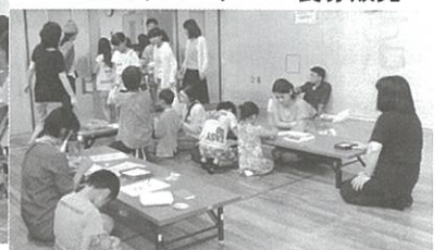
児童館・遊びランド