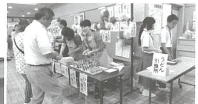
レストコーナー・食券販売

9月6日(日)、あいにくの雨の中での開催となりましたが、会場の古田公民館・児童館には多くの方に足を運んでいただきました。