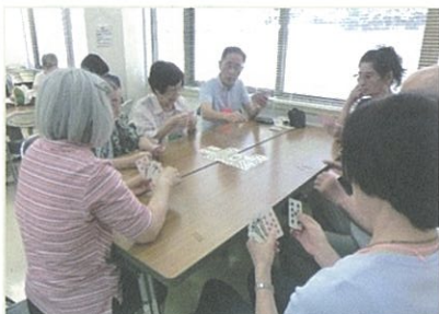
このテーブルはトランプ

淹れ立てのコーヒーが楽しみのひとつです。軽く体を動かし、歌ったあとは、各々が手芸、折り紙、トランプなどやりたいものを作ります。