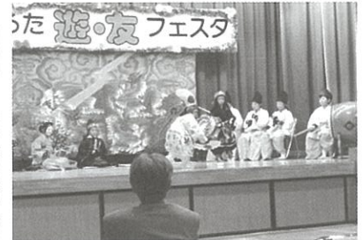
ふるた遊・友フェスタで「天の岩戸」を舞う子ども達

11月1日(日)、西区民祭りイベントステージに出演し、「天の岩戸」を披露しました。また、イベントコーナーでは「子ども神楽衣装試着」を実施しました。