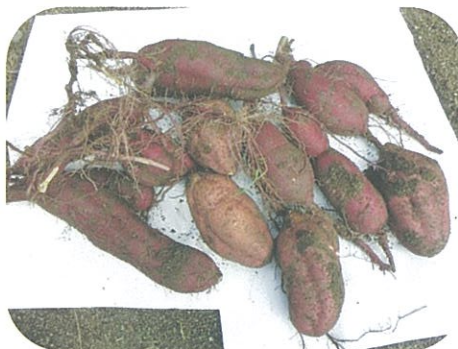
安納芋と紅あずま

野菜と花とハーブを育てています。畑づくりも軌道に乗ってきました。サツマイモも大きくなってきた、大喜び。春にスイセンが、畑を彩るのが楽しみです。