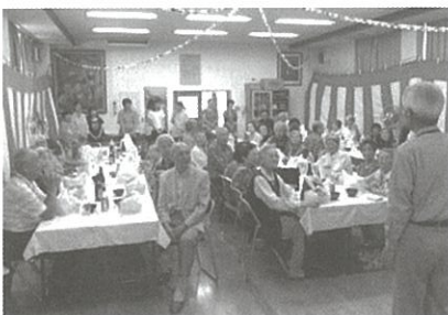
和やかなひと時を過ごしました

田方町内会報より 9月13日(日)田方集会所にて敬老会を開催。招待客38名(75歳以上の対象者167名)をお招きしての会でした。