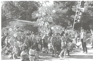
いまから町内をまわります

古江女性会 10月10日(土)、11日(日)の両日、ふるた遊・友フェスタにおいて、「義援金バザー」を担当しました。収益は2万3020円でした。